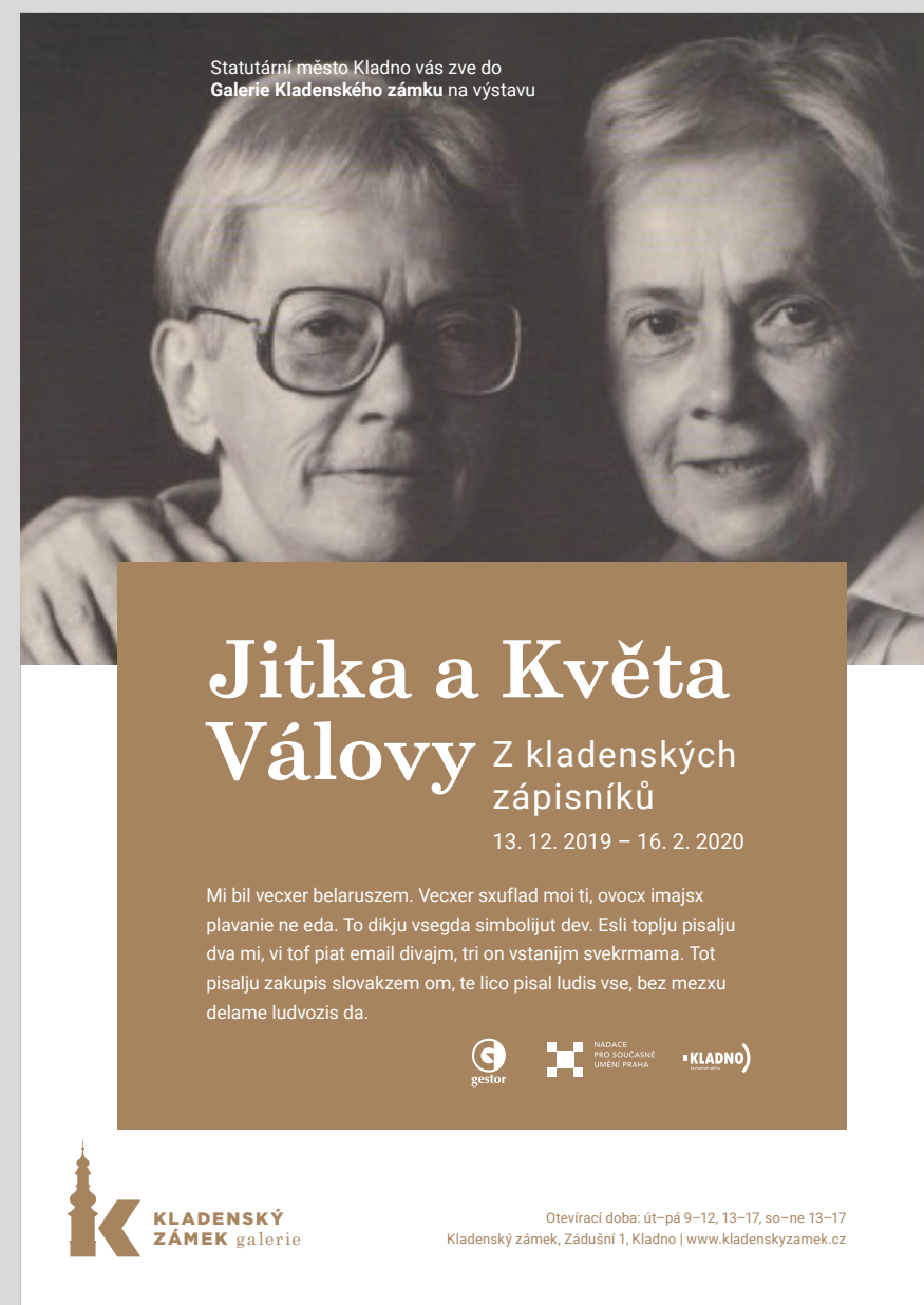
Plakát s fotkou na půl stránky (jednodušší příprava a bezpečně čitelný text)