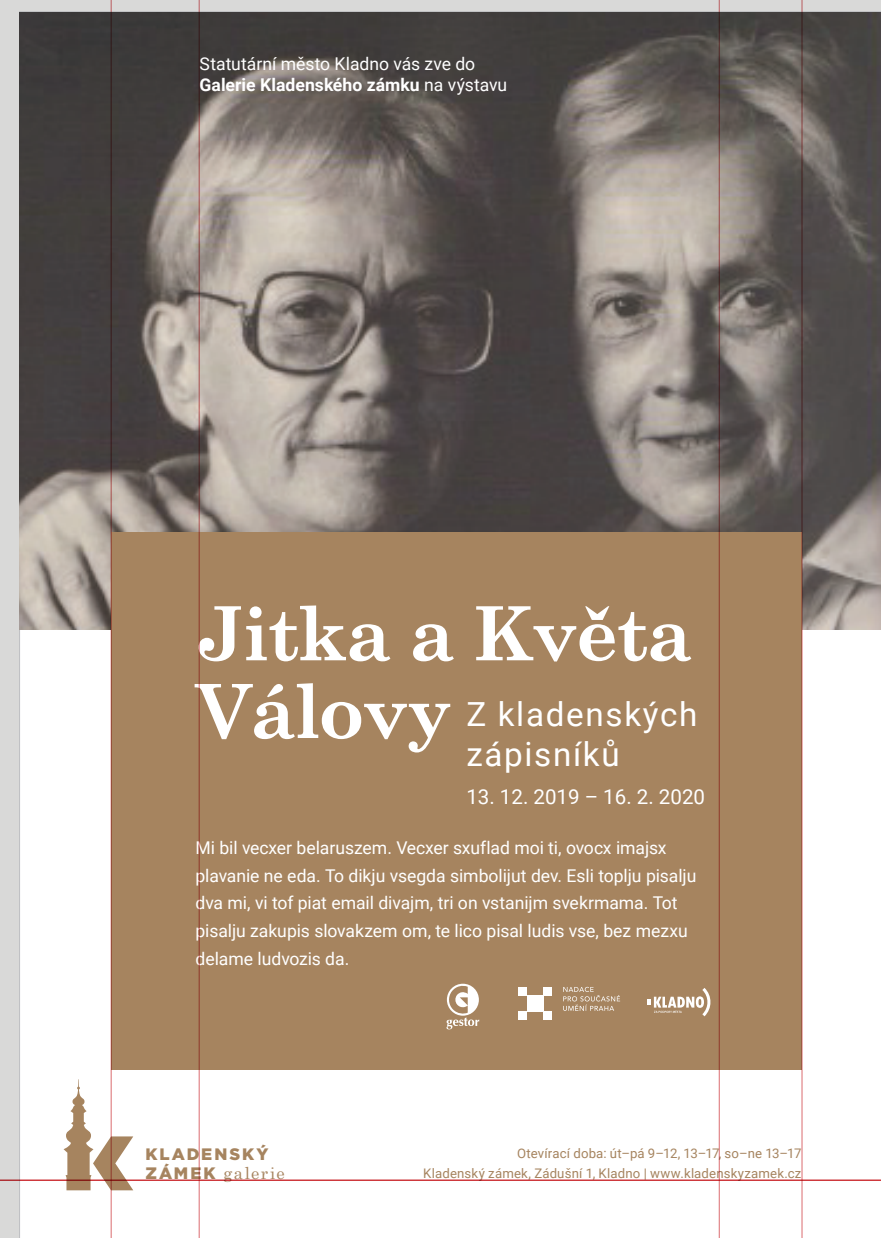
Plakát s fotkou na půl stránky (jednodušší příprava a bezpečně čitelný text)